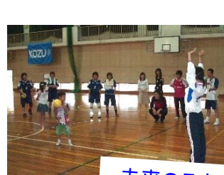
未来のスター選手