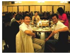
楽しい総会懇親会でした…また今年も逢いましょう 今年(2006年)の総会は 7月1日(土) です