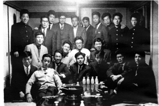
1956年(昭和31年)12月全日本室内選手権 高津クラブ第1回戦対全芝浦工大に大敗 (7人制最初の促成チーム公式戦)