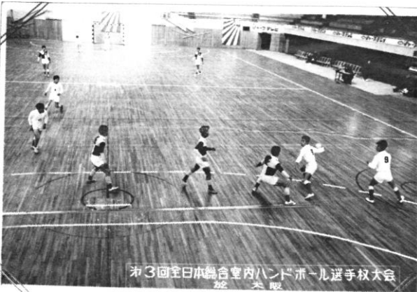
第3回全日本総合室内ハンドボール選手権大会 館 大阪