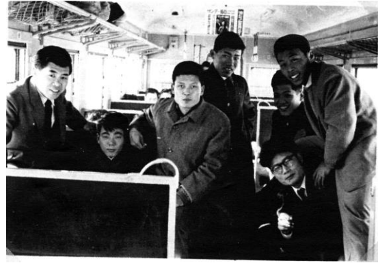
1956年(昭和31年) 高津クラブ名古屋遠征のスナップ